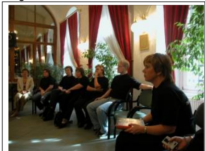
En lydhør forsamling på besøk på det pedagogiske senteret

Vi var der mye lengre enn avtalt tid for, for det var mange likheter og ulikheter på barnehagesektoren som skulle utveksles mellom de to landene.