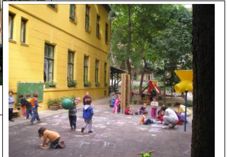
Utelekeplass med høye bygninger på alle kanter

Barnehagen ligger i et hus i tre – fire etasjer. Utelekeplassen var i atriumet på baksiden av huset. Deler av uteplass