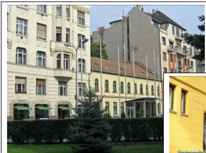
Barnehagen er i bygningen til venstre.

var overbygd slik at de om sommeren kunne holde på med tegning ol. aktiviteter ute.