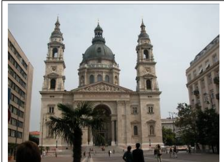
St. Stefan Basilika