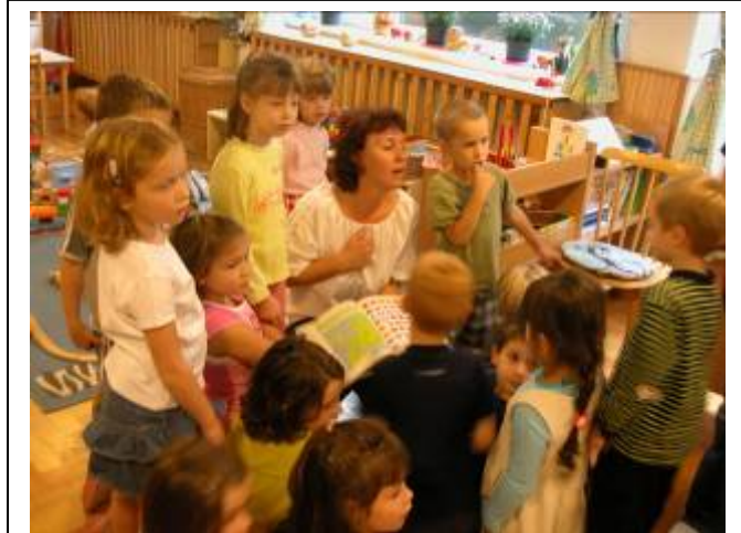
De ser i atlaset for å finne Norge

Barna hadde forberedt seg på at vi skulle komme. De hadde snakket om Norge og tegnet det norske flagget og vi måtte vise i en heller dårlig atlas hvor i Norge vi kom fra.