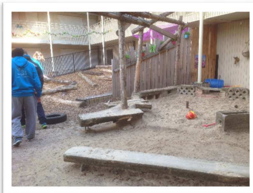
Litt annen type utelekeplass enn vi er vant med.

Besøket både på skolen og i barnehagen var veldig interessant.